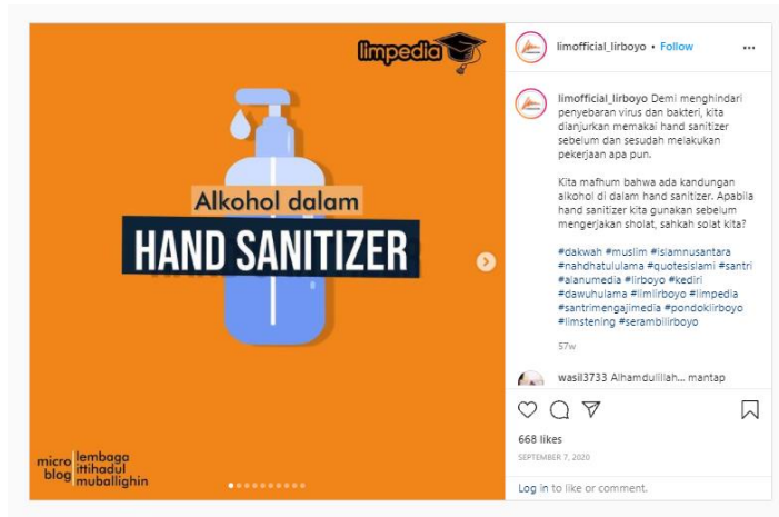
Gambar 2. Konten Alkohol dalam Hand Sanitizer.