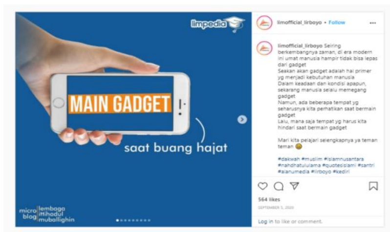
Gambar 3. Konten Main Gadget saat Buang Hajat.

Keempat, dengan tahap terakhir, treatment/ suggest recomendasion . Dimana berangkat dari penyimpulan tahap satu hingga tiga: bahwa alkohol dalam hand sanitizer tidak membatalkan wudhu sehingga berpengaruh para status keabsahan salat. Hal ini ditegaskan melalui sudut pandang yang dikonstruksikan dalam konten mereka, terutama dalam slide-slide yang sudah disinggung dalam tahap dua dan tiga. Sehingga, hukum alkohol dalam hand sanitizer sebagai bentuk ikhtiar hifdz nafs dari virus atau bakteri, terlebih di masa pandemi Covid-19 itu secara hukum di ma’fu dan tidak menjadi sebab pembatal salat karena sifatnya yang darurat dan tidak bisa dihindari.