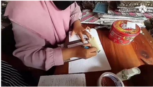
Gambar 2. Proses Pencatatan Transaksi

Permasalahan ini tentu saja merepotkan dan membuat proses bisnis kurang berjalan secara optimal. Sehingga UMKM Adhinata Batik menjadi cenderung lambat dalam merespon permintaan konsumen yang akan berdampak terhadap kehilangan kesempatan menjual bagi UMKM.