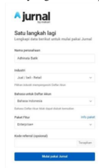
Gambar 4. Pembuatan Akun

Setelah memperkenalkan terlebih dahulu dan berdiskusi dengan pemilik akan aplikasi Jurnal.id, pada tanggal 2 September 2021 untuk pertama kali dibuatkan akun dummy pada aplikasi Jurnal.id. pembuatan akun dummy dimaksudkan untuk menunjukkan feature yang dimiliki aplikasi ini.