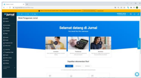
Gambar 5. Dashboard Jurnal.id

Aplikasi Jurnal.id memiliki banyak menu dan feature yang bisa digunakan oleh pengguna. Pada bagian sebelah merupakan menu utama yang ada pada aplikasi ini, mulai dari pengaturan ( setting ) perusahaan sampai pembuatan laporan yang dibutuhkan oleh pengguna. Aplikasi ini juga mampu mencatat aset yang dimiliki perusahaan baik kas, persediaan maupun aset tetap yang dimiliki.