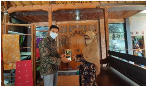
Gambar 7. Pemberian Kenang-kenangan

Hasil evaluasi juga menunjukkan jika UMKM Adhinata Batik sudah siap menerapkan aplikasi ini kedalam proses bisnisnya. Meskipun masih ada kebingungan dari karyawan dalam mengoperasikan aplikasi, namun hal tersebut wajar karena karyawan baru pertama kali mengenal aplikasi ini. ketersediaan sarana dan prasarana penunjang juga telah tersedia seperti laptop dan juga jaringan internet. Pada akhir dari rangkaian kegiatan pengabdian, pengabdian juga memberikan kenang-kenangan kepada pemilik dan foto bersama dengan seluruh anggota pengabdian.