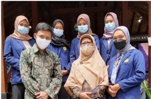
Gambar 8. Tim Pengabdian dan Pemilik